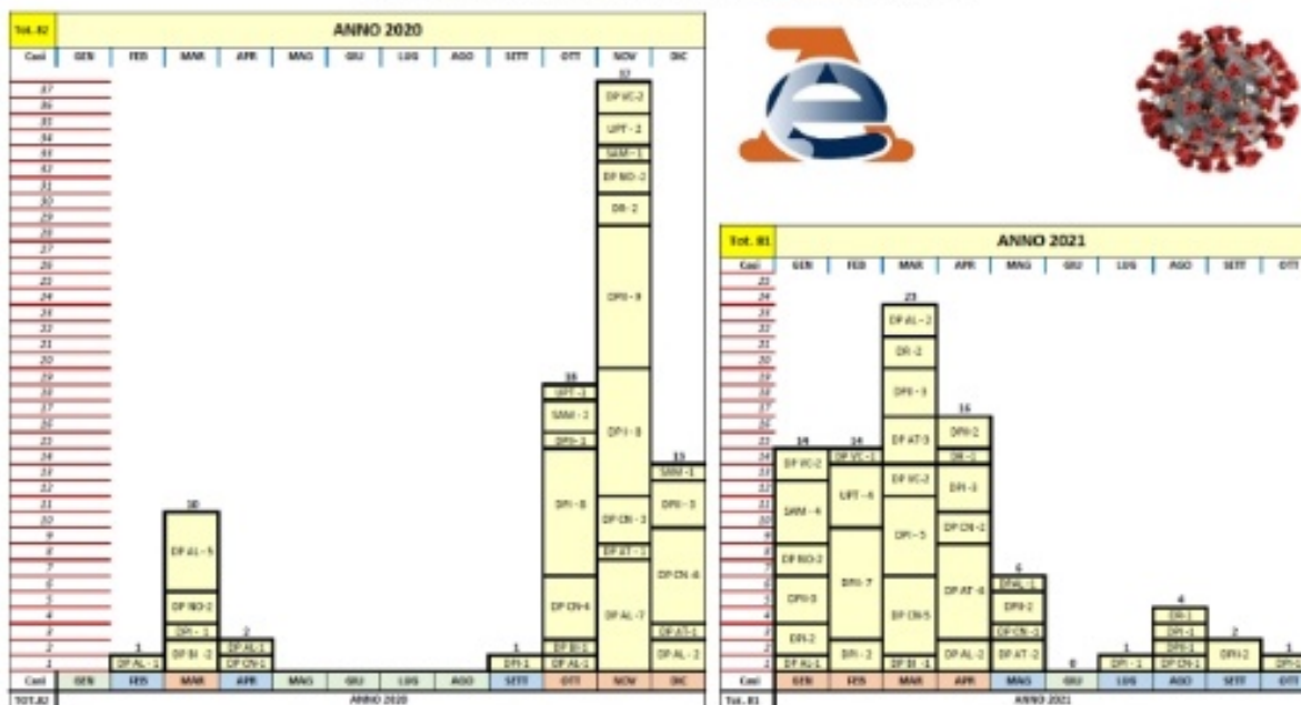
Dati forniti dalla Direzione Regionale dell'Agenzia delle Entrate graficamente elaborati da USB PI

Dopo un'analisi dei dati di parte pubblica, nel nostro intervento abbiamo sostenuto l'importanza di salvaguardare i protocolli sulla sicurezza siglati tra Amministrazione e Parte Sindacale , in vigore fino al perdurare dello stato di emergenza ( Protocollo d'intesa per la definizione delle misure di prevenzione e la sicurezza dei dipendenti pubblici in ordine all'emergenza sanitaria da Covid-19 , siglato il 03/05/2020 da Amministrazione e USB-PI, Protocolli Regionali e Protocolli Provinciali).